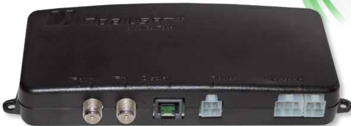
Unità di controllo DVB-S2 HD

SATedit è l'innovativo ed esclusivo sistema per inserire qualsiasi satellite per la diffusione di programmi televisivi in banda KU, inserendo le frequenze identificative fino a 4 satelliti, oltre ai già 16 preimpostati.